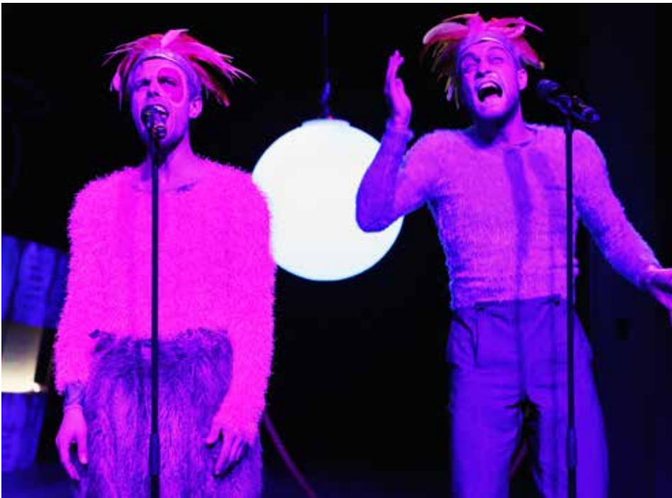
Szenenfoto mit ((bitte ergänzen; auf diesem Bild kann ich die beiden nicht gut unterscheiden))